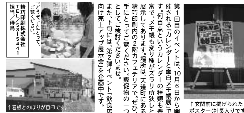
↑玄関前に掲げられたポスター(社長入りです)

第10目のイベントは、10月6日から開催される「カレンダー」と面白メロ帳展です。何百点というカレンダーの種類も豊富で、メモ帳も変り種がズラリ所狭しと展示してあります。