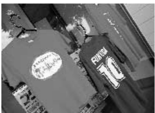
店頭に飾ってあるTシャツいろいろです。

みなさん、こんにちは。いよいよ本格的な夏到来ですね。私たちがちよと衣替えして、Tシャツを着替えています。 しかし、暑いとはいえ、そんなときは、Tシャツに着替えて、うちわ片手に町を闊歩なんかどうですか。おかげさまで、7月はTシャツの引き合いが多く、色々お作らしてもらいました。大牟田夏祭り用のTシャツ、県大会出場のカッカ一部保護者会用Tシャツ、音楽好きの集まりの倶楽部Tシャツ、彼女にプレゼントするためのTシャツなど…。 ホント、色々なお客様がいて、色々な用途があるんだと痛感しています。